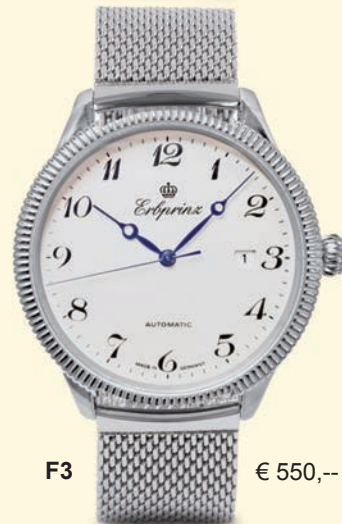
F3 € 550,--

Bicolor-Ausführung goldplattierte Lünette