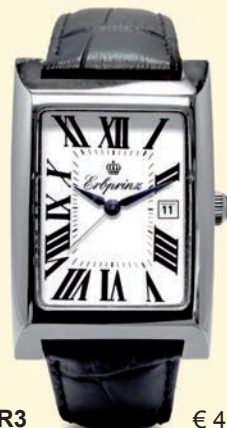
BFR3 € 450,-