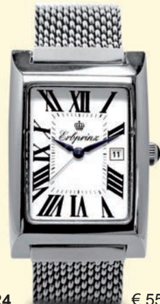
BFR4 € 550,-

Handaufzugswerk Ronda 4135 - Kalender Kaliber 8 3/4, Vollanker 17 Steine 21.600 A/h Gangreserve 42 Std.