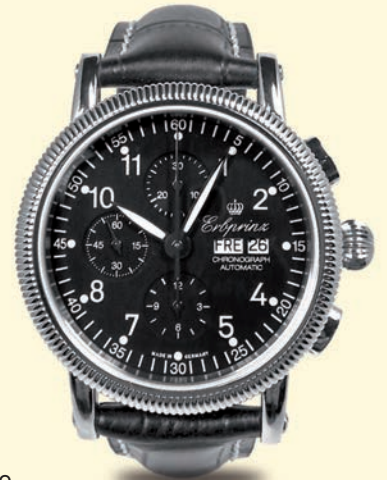
M3 € 1.190,-

Rillen-Edelstahlgehäuse, Ø 44 mm, Höhe: 14,7 mm, 5 atm, Saphirglas, Leucht- ziffern und -zeiger, Day- Date, Lederband mit Steppnaht oder mit SES Milanaise-Geflechtband mit Struktur aus der eige- nen Manufaktur.