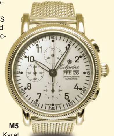
M5 18 Karat goldplattiert € 1.375,-