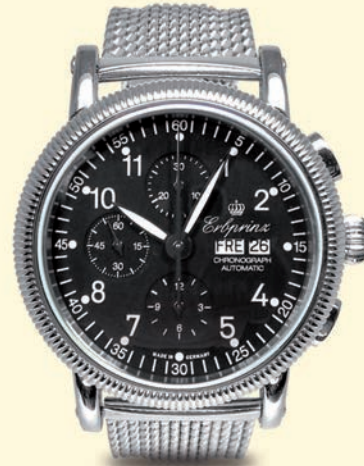
M4 € 1.290,-

Rillen-Edelstahlgehäuse, Ø 44 mm, Höhe: 14,7 mm, 5 atm, Saphirglas, Leucht- ziffern und -zeiger, Day- Date, Lederband mit Steppnaht oder mit SES Milanaise-Geflechtband mit Struktur aus der eige- nen Manufaktur.