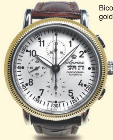
M1 € 1.190,-

Die sportlich männliche Erbrprinz "Mannheim" erweist ihre Referenz jener pulsierenden badischen Stadt, wo der Automobil-Erfinder Carl Benz und andere Industrie-Pioniere ihre Visionen verwirklichten. Als Antrieb für diese markante Mischung aus Eleganz und hochwertiger Technik empfahl sich das Chronographen-Automatikwerk „ETA Valjoux 7750“, das auch in Zukunft in den Spitzenklasse-Uhren aus der Pforzheimer Erbrprinzenstraße verbaut wird.