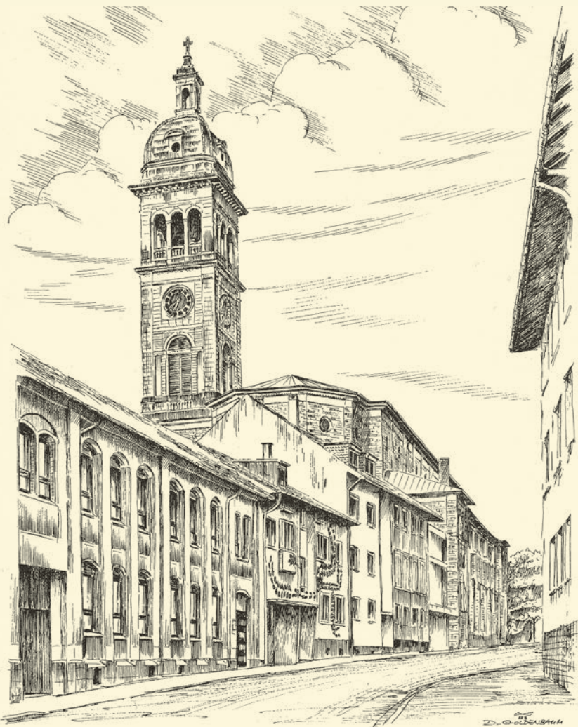
ARISTO VOLLMER GmbH Uhren und Metallbandmanufaktur Erbprinzenstraße PFORZHEIM