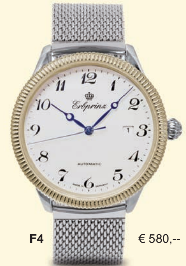
F4 € 580,--

ARISTOMATIC SW 200 Caliber 11 1/2, 28.800 A/h, 26 Steine Incabloc Stoßsicherung, Sekunden-Stopp, Gangreserve 42 Stunden