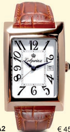
BFA2 € 450,-

Die „Black Forest“ ist die erste Erbrprinz-Serie, die mit einem Handaufzugswerk ausgestattet ist und ihre Modell-Bezeichnung in englischer Sprache trägt. Das ausgewogene Verhältnis von Rundungen und Ecken, von Retro-Nostalgie und einem zeitlos markanten Design fasziniert jeden Betrachter sofort. Die Kombination von diesem ausgefallenen Gehäuse mit einem entsprechend hochwertigen Kaliber, dem Handaufzugswerk 4135 von dem Schweizer Uhrwerke-Hersteller Ronda ist einzigartig. Der Modell-Name ist unsere Hommage an Pforzheim, die Uhren- und Schmuck-Metropole im Schwarzwald.