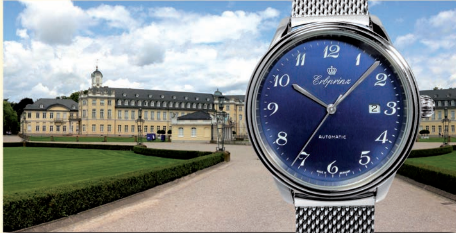
K1 € 575,--

300 Jahre zuvor ließ der Markgraf Karl Wilhelm von Baden-Durlach seine Residenz „Carols Ruh“ errichten. Mit dieser – zunächst als Lustschloss geplanten – Residenz legte er den Grundstein für die heutige Stadt Karlsruhe. Diese Stadt glänzt heute nicht nur mit ihrem Barock-Schloss. Dank ihrer Universität strahlt die Stadt viel Jugendlichkeit aus und profiliert sich gleichzeitig als Standort von Lehre und Forschung. Umfragen bestätigen immer wieder, dass die Menschen bei dem Namen „Karlsruhe“ an das politisch aktuell bedeutsame Bundesverfassungsgericht denken.