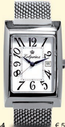
BFA4 € 550,-