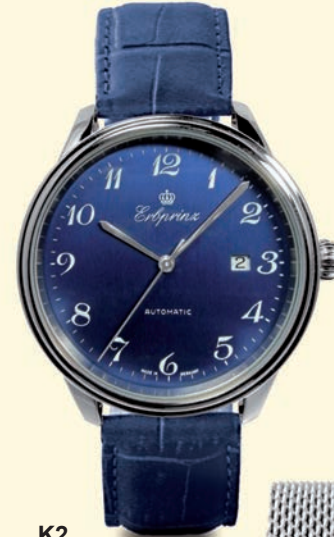
K2 blaues Zifferblatt € 525,--

300 Jahre zuvor ließ der Markgraf Karl Wilhelm von Baden-Durlach seine Residenz „Carols Ruh“ errichten. Mit dieser – zunächst als Lustschloss geplanten – Residenz legte er den Grundstein für die heutige Stadt Karlsruhe. Diese Stadt glänzt heute nicht nur mit ihrem Barock-Schloss. Dank ihrer Universität strahlt die Stadt viel Jugendlichkeit aus und profiliert sich gleichzeitig als Standort von Lehre und Forschung. Umfragen bestätigen immer wieder, dass die Menschen bei dem Namen „Karlsruhe“ an das politisch aktuell bedeutsame Bundesverfassungsgericht denken.