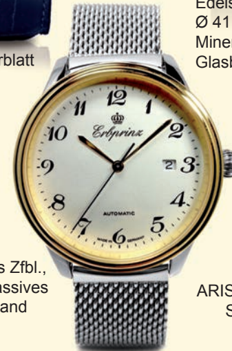
K3 versilbertes Zfbl., Bicolor, massives Milanaisband € 595,--

Edelstahlgehäuse, Ø 41 mm, 5 atm, Mineralglas, Glasboden