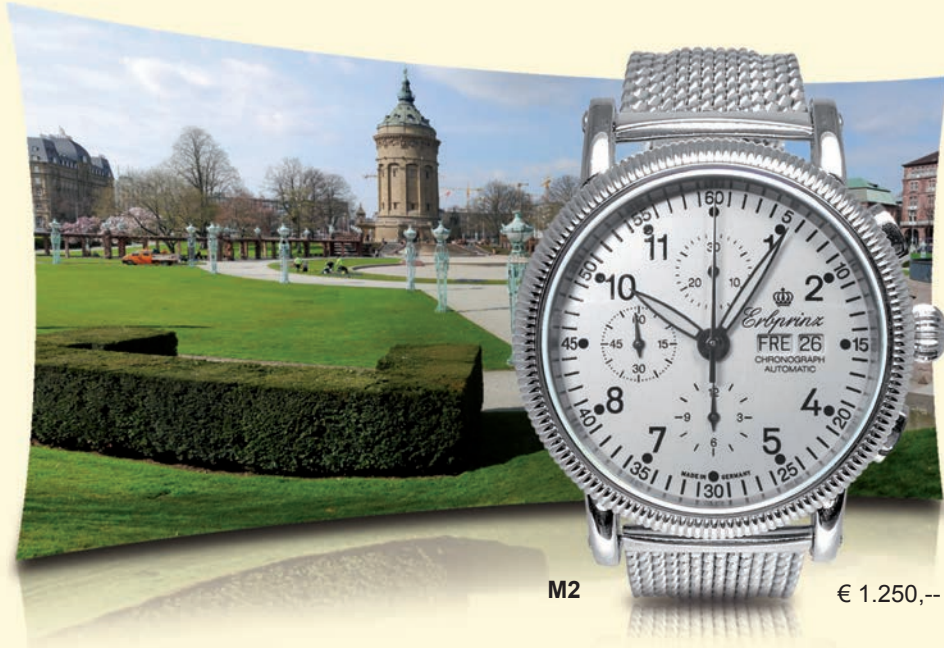
M2 € 1.250,-

Die sportlich männliche Erbrprinz "Mannheim" erweist ihre Referenz jener pulsierenden badischen Stadt, wo der Automobil-Erfinder Carl Benz und andere Industrie-Pioniere ihre Visionen verwirklichten. Als Antrieb für diese markante Mischung aus Eleganz und hochwertiger Technik empfahl sich das Chronographen-Automatikwerk „ETA Valjoux 7750“, das auch in Zukunft in den Spitzenklasse-Uhren aus der Pforzheimer Erbrprinzenstraße verbaut wird.