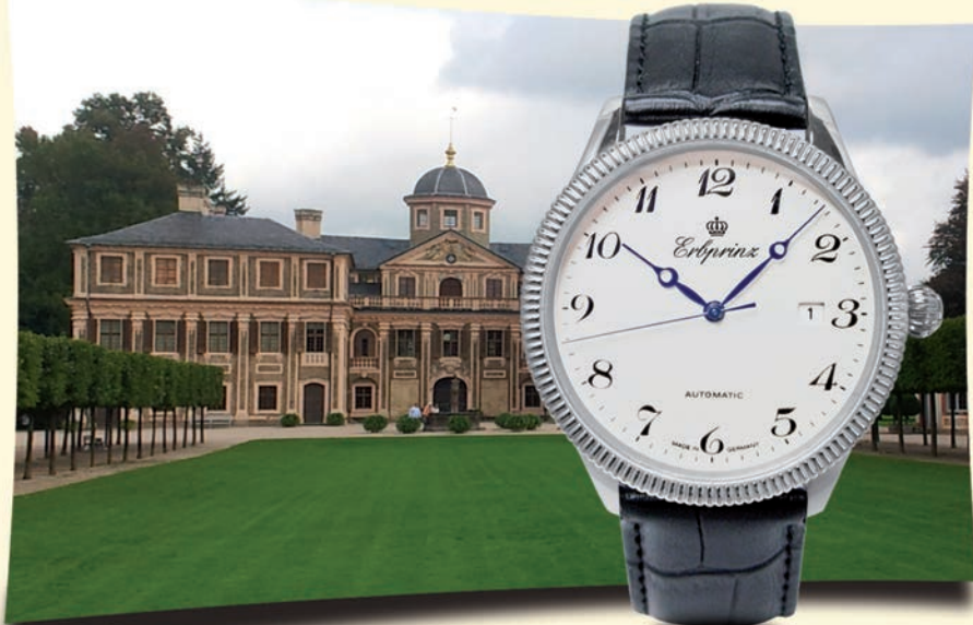
F1 € 495,--

Das Schloss Favorite ist jenes erste deutsche „Porzellanschloss“, das die Markgräfin Sibylla Augusta von Baden-Baden vor den Toren von Rastatt hatte bauen lassen. Die Erbpinz „Favorite“ ist eine Uhr, die den Geist dieser Epoche widerspiegeln soll. Die filigranen Zeiger sind nach dem legendären Schweizer Uhrmacher Breguet benannt. Er zählte auch zu den berühmtesten Finisseuren der Uhrmacher-Geschichte. Die umlaufende Dekoration am Uhrgehäuse der Erbpinz „Favorite“ erinnert an die Formensprache dieses legendären Uhrmachers.