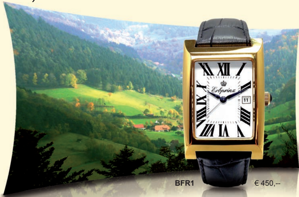
BFR1 € 450,-

Die „Black Forest“ ist die erste Erbrprinz-Serie, die mit einem Handaufzugswerk ausgestattet ist und ihre Modell-Bezeichnung in englischer Sprache trägt. Das ausgewogene Verhältnis von Rundungen und Ecken, von Retro-Nostalgie und einem zeitlos markanten Design fasziniert jeden Betrachter sofort. Die Kombination von diesem ausgefallenen Gehäuse mit einem entsprechend hochwertigen Kaliber, dem Handaufzugswerk 4135 von dem Schweizer Uhrwerke-Hersteller Ronda ist einzigartig. Der Modell-Name ist unsere Hommage an Pforzheim, die Uhren- und Schmuck-Metropole im Schwarzwald.