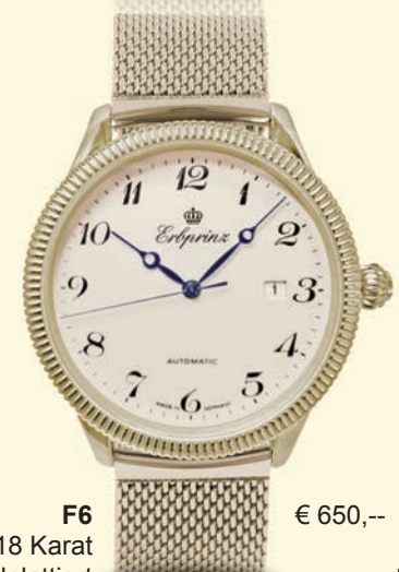
F6 € 650,-- 18 Karat goldplattiert