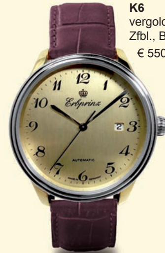
K6 vergoldetes Zfbl., Bicolor € 550,--