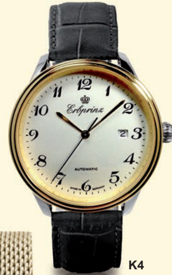
K4 versilbertes Zfbl., Bicolor € 550,--