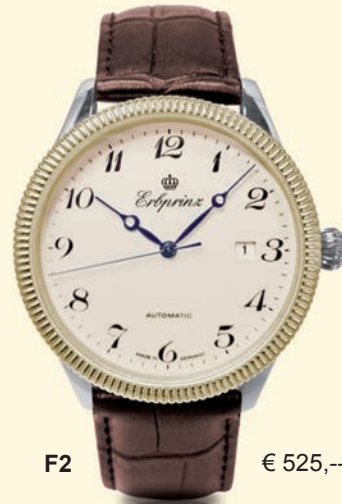
F2 € 525,--

Das Schloss Favorite ist jenes erste deutsche „Porzellanschloss“, das die Markgräfin Sibylla Augusta von Baden-Baden vor den Toren von Rastatt hatte bauen lassen. Die Erbpinz „Favorite“ ist eine Uhr, die den Geist dieser Epoche widerspiegeln soll. Die filigranen Zeiger sind nach dem legendären Schweizer Uhrmacher Breguet benannt. Er zählte auch zu den berühmtesten Finisseuren der Uhrmacher-Geschichte. Die umlaufende Dekoration am Uhrgehäuse der Erbpinz „Favorite“ erinnert an die Formensprache dieses legendären Uhrmachers.